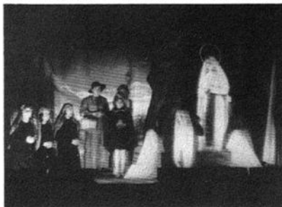
Een scène uit Maria's macht te Lourdes.