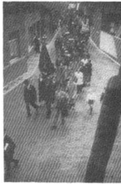
Nog een foto van Victoria genomen in de Maasstraat.

De heer Sents uit Nieuwstadt werd directeur van de Jonge vereniging. Met veel publiciteit en onder veel belangstelling hield het Berge Mannenkoor op zondag 26 september 1937 haar stichtingsfeest. Om vier uur 's middags vond een druk bezochte receptie plaats waarbij verschillende bloemstukken aan de vereniging werden aangeboden, o.a. door voetbalvereniging IVS en de Hengelvereniging. Na deze receptie vond met medewerking van de Harmonie een muzikale wandeling door het