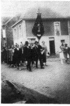
Victoria met vaandel in optocht door Berg